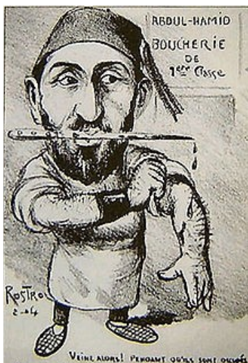
Una caricatura política francesa contemporánea retrata al sultán Abdul Hamid II como un carnicero de los armenios.

"...Pero cuál no sería mi asombro al darme cuenta que los agresores habían sido las mismas autoridades civiles que, apoyadas por los kurdos y los facinerosos del vecindario, se hallaban asaltando y saqueando el barrio armenio, en que tres o cuatrocientos artesanos cristianos se defendían desesperadamente contra esa turba de forajidos, quienes, tumbando puertas y saltando tapias, penetraban en las casas y, después de acuchillar a sus indefensas víctimas, obligaban a las mujeres, madres o hijas de aquellos desgraciados a arrastrar sus cuerpos por